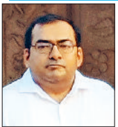
शरीर की अधिकांश बीमारियां स्वयं बाहर निकल जाती हैं।