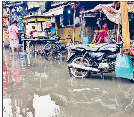
झज्जर। पुराना बस अड्डा मार्ग पर हुआ जलभराव।