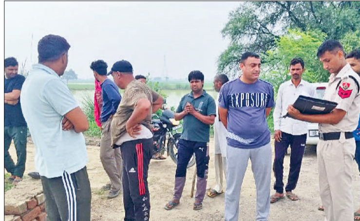
बहादुरगढ़। मौके पर मौजूद पुलिस और ग्रामीण।

दरअसल, यहां गांव खरहर से रेवाड़ीखेड़ा माइनर गुजर रही है। सुबह के वक्त टहलने निकले किसी व्यक्ति की नजर माइनर में पुलिया के पास अटके शव पर गई। इसके बाद पुलिस को सूचना दी गई। पुलिस मौके पर पहुंची और शव को निकालने के प्रयास किए।