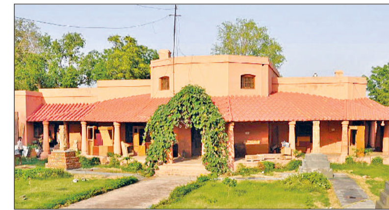
हिसार स्थित जॉर्ज कोर्टी जो जॉर्ज थॉमस का निवास स्थान थी, इसे वर्तमान में जहाज कोर्टी के नाम से जानते हैं। हांसी के प्राचीन किले के अवशेष जहां जॉर्ज ने अपने राज्य की राजधानी स्थापित की।

जार्ज पर धावा बोलने का आदेश दे दिया। लेकिन तब तक जार्ज थॉमस एक बड़ी सेना गठित कर चुका था। वह हांसी के किले में तोपे बनाने का कार्य कर चुका था। उसके तीन और स्थानों झज्जर, जहाजगढ़ तथा हांसी में पर्याप्त युद्ध सामग्री का संग्रह हो चुका था। मराठों तथा जार्ज दोनों की सेनाओं में यूरोपीय कमांडर नियुक्त थे। जनरल पैरो फ्रान्स देश का वासी था। अन्ततः वार्ता आदि के विफल रहने पर मराठा सेना ने लुईस बैरकीन के नेतृत्व में जार्ज के गढ़ जहाजगढ़ पर सितम्बर 1801 में आक्रमण कर दिया। जनरल पैरो स्वयं झज्जर तक आया तथा मरे खां नामक अधिकारी को झज्जर का प्रशासक बनाया गया। फिर बैरकीन व स्मीथ की सेना ने भारवाच शली तथा माजरा गांव के पास कैम्प किया। उधर जार्ज भी हांसी का चार्ज रोहिला बटालियन को सौंपकर जहाजगढ़ किले में पहुंच गया और सितम्बर के अन्तिम सप्ताह