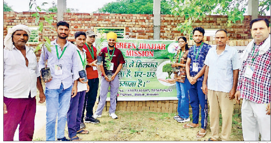
इज्जर। कार्यक्रम के दौरान हाथों में पौधे लिए हुए ग्रुप सदस्य।