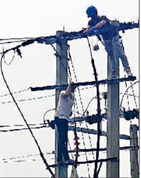
झज्जर। नए फीडर पर काम करते बिजली निगम के कर्मचारी।