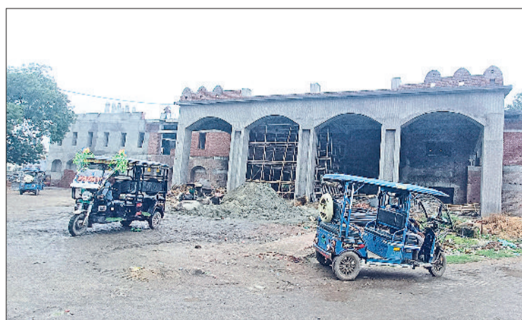
बहादुरगढ़। सुधारीकरण के तहत रेलवे स्टेशन पर जारी नए भवन का निर्माण।

अमृत भारत स्टेशन योजना के तहत बहादुरगढ़ रेलवे स्टेशन के सुधारीकरण का काम जारी है। नए भवन के साथ ही आधुनिक पार्किंग, प्लेटफार्म का विस्तार, ओवरब्रिज का निर्माण चल रहा है। विदित है कि प्रधानमंत्री नरेंद्र मोदी ने 6 अगस्त 2023 को बहादुरगढ़ रेलवे स्टेशन समेत देश के 508 रेलवे स्टेशनों के आधुनिकीकरण की वचुअल माध्यम से आधारशिला रखी थी। बता दें कि 1932 में निर्मित बहादुरगढ़ रेलवे स्टेशन दिल्ली रोहतक रेलमार्ग पर हरियाणा का पहला रेलवे स्टेशन है। यहां से करीब 10 हजार लोग रोजाना ट्रेन के जरिए आवागमन करते हैं। अधिकारियों की मानें तो इस रेलवे स्टेशन से रोजाना 22 एक्सप्रेस ट्रेन, 56 पैसंजर ट्रेन और करीब 65 मालगाड़ियां भी गुजरती हैं। करीब 2 साल पहले शुरू हुए स्टेशन के आधुनिकीकरण कार्य पर प्रथम चरण में 25 करोड़ रुपए की धनराशि खर्च होगी। इसके तहत नए भवन का निर्माण और मौजूदा भवन का नवीनीकरण, वेंटिंग हॉल और पैसंजर फ्रेंडली आधुनिक सुविधाएं,