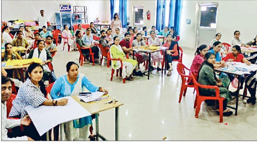
इज्जर। कैपेसिटी बिल्डिंग प्रोग्राम में उपस्थित शिक्षक।

व क्षेत्र के अलग-अलग हिस्सों में लगाए जाते हैं। आम तौर पर देखने में आता है कि पौधे लगाने के बाद इनकी देखभाल के लिए न तो कोई प्रबंध किया जाता है और न ही किसी अन्य की जिम्मेवारी तय होती है, परिणाम यह निकलता है कि पौधा फल-फूल नहीं पाता। उन्होंने लोगों से आह्वान किया कि वे उन पौधों की अच्छी प्रकार देखभाल करें और समय पर पानी अवश्य डालें।