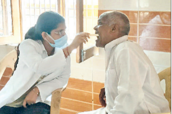
बहादुरगढ़। छारा में ग्रामीणों का स्वास्थ्य जांचती चिकित्सक।