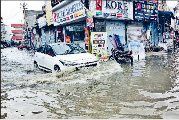
झज्जर। अंबेडकर चौक पर हुए जलभराव के बीच गुजरते हुए वाहन।