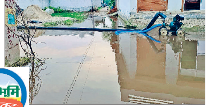
झज्जर। पंप सेट शुरू कर पानी निकासी में जुटे कर्मचारी।

शहर की नीमवाली कालोनी के लोगों को जल भराव की समस्या से निजात दिलाने के लिए नगर परिषद द्वारा पानी निकासी का कार्य शुरू कर दिया गया है। रविवार को नगर परिषद के कर्मचारियों ने दिनभर पंप सेट चालू कर गली से पानी की निकासी का कार्य किया। जलस्तर कम होने पर कालोनीवासियों को भी समस्या से छुटकारा मिलने की उम्मीद बढ़ी है। बता दें कि नीमवाली कालोनी वासियों की इस समस्या का संज्ञान लेते हुए हरिभूमि समाचार पत्र ने रविवार के अंक में इसे प्रमुखता से प्रकाशित किया था। जिसकी सुध लेते हुए नगर परिषद द्वारा रविवार को जल निकासी व्यवस्था का कार्य शुरू किया गया। जिसके चलते कालोनी निवासियों ने हरिभूमि समाचार पत्र का आभार जताया। उन्होंने कहा कि निकासी होने से लोगों ने राहत की सांस ली है।