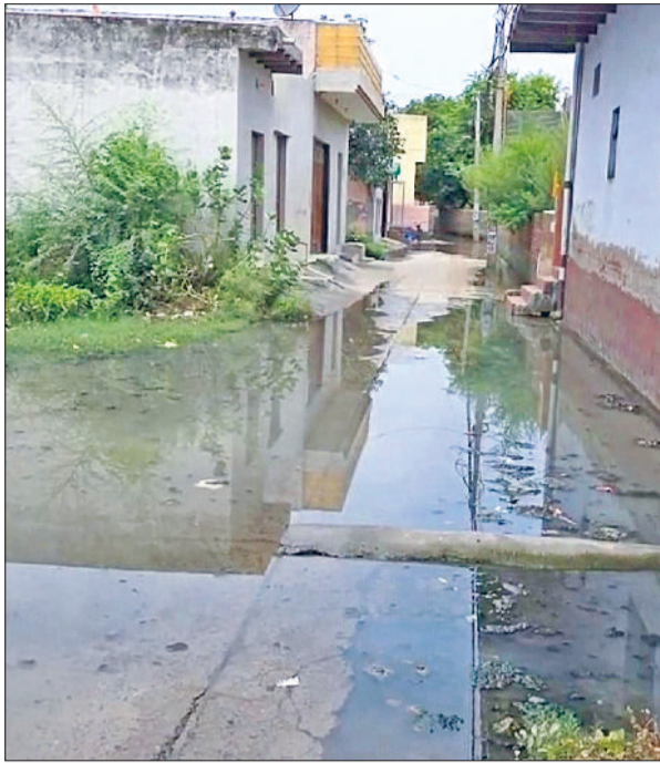
बहादुरगढ़। आर्य नगर की गली नंबर-5 में भरा गंदा पानी।